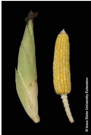
黄熟期(上)と完熟期(下)の雌穂