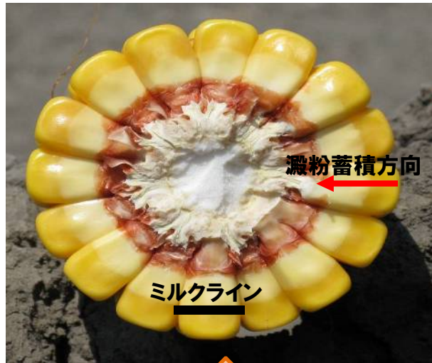
黄熟中期(ミルクライン1/2)の雌穂断面